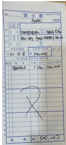
<AFA 축하꽃바구니 영수증> / 120,000원